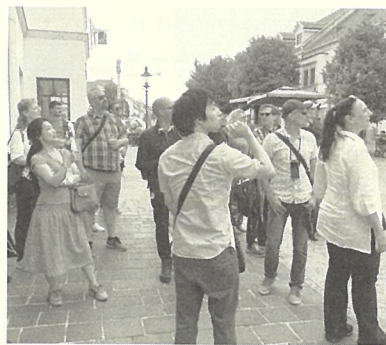
緊張感漂う練習風景

実際に初めてお客様をご案内したのはベルベデーレ宮殿になりました。思いの外緊張はしませんでした。が、単語をドイツ語で覚えた影響で日本語の名前が出ずに苦戦をしました。またご夫婦でいらしたお客様をご案内した際には「次回ウィーンに来る際はぜひもう一度ガイドをお願いします」と言われ、非常に嬉しい気持ちになりました。