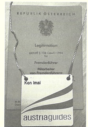
国家公認ガイドの証

入場観光はシェーンブルン宮殿のマリー・アントワネットの部屋で当たりました。他にもバス観光、徒歩観光を行い、試験後は結果発表を待ちました。参加者は7名で個別に呼ばれ、前に呼ばれた人が不合格と聞いた直後に私の名前が呼ばれたので、恐る恐る向かいました。例の厳しい試験官の口から「Herzlichen Glückwunsch」(合格)おめでとうございますと言われた時には全身の力が抜け、その後の言葉はほとんど耳にはいってきませんでした。家に帰った後に実感し始めたのか、自然と涙があふれてきました。